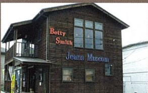
D ベティスミスジーンズミュージアムアウトレット

児島商工会議所 ☎086-472-4450 倉敷観光コンベンションビューロー ☎086-421-0224 JR児島駅観光案内所 ☎086-472-1289